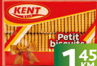
PETIT KEKS Kent, 400g