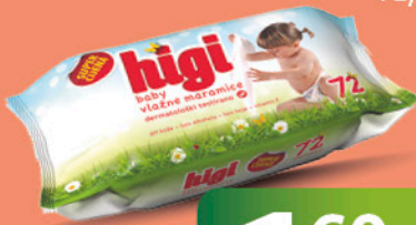
HIGI baby vlažne maramice, 72/1