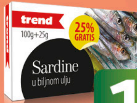
TREND SARDINE u biljnom ulju, 100g+25g GRATIS, kom