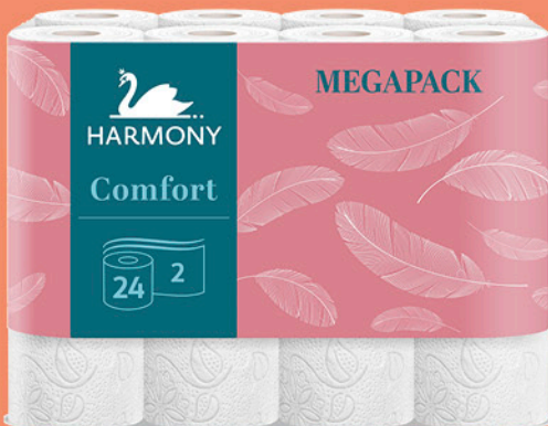
HARMONY toaletni papir, Com- fort, dvoslojni, 24/1