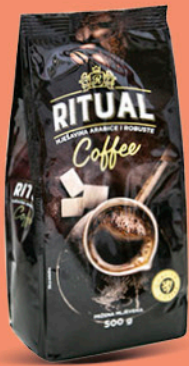
RITUAL mljevena kafa, 500g