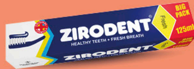
ZIRODENT pasta za zube, Fresh, 125ml