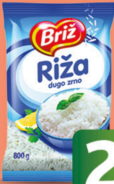
RIŽA dugo zrno, Briž, 800g