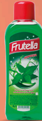
FRUTELLA šampon za kosu, kopriiva, 1l