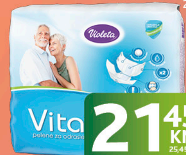
VITA pelene za odrasle, L, Violeta, 20/1