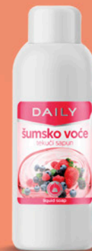
DAILY tečni sapun, šumsko voće, 1l