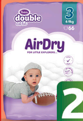
AIR DRY Violeta Double Care, dječije pelene, vel.:3, 66/1, pak